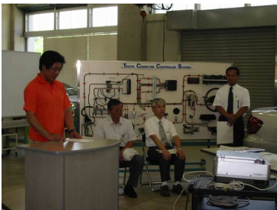
南山先生の受講生代表謝辞