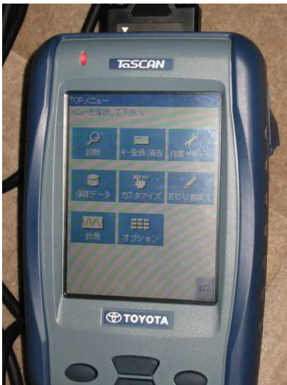
T - S キャン 非常に便利で高価なテスター