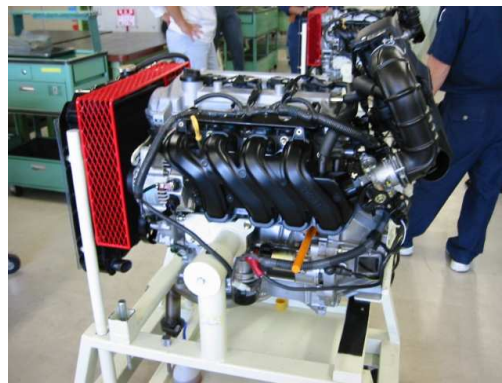
エンジンが反転できます