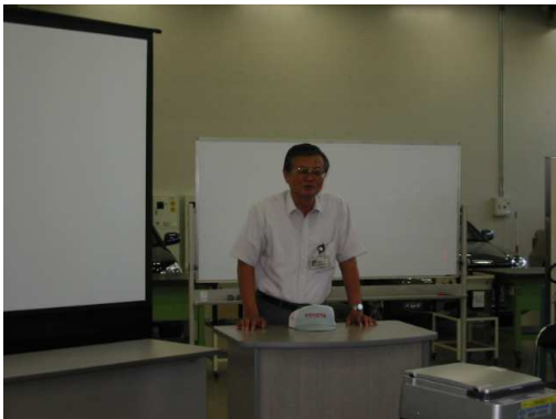
閉講式でのご挨拶