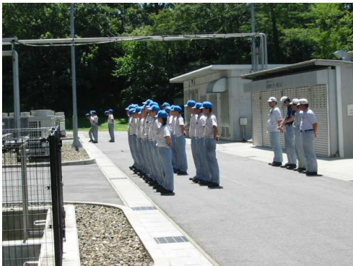
昼礼中のトヨタ工業学園生徒