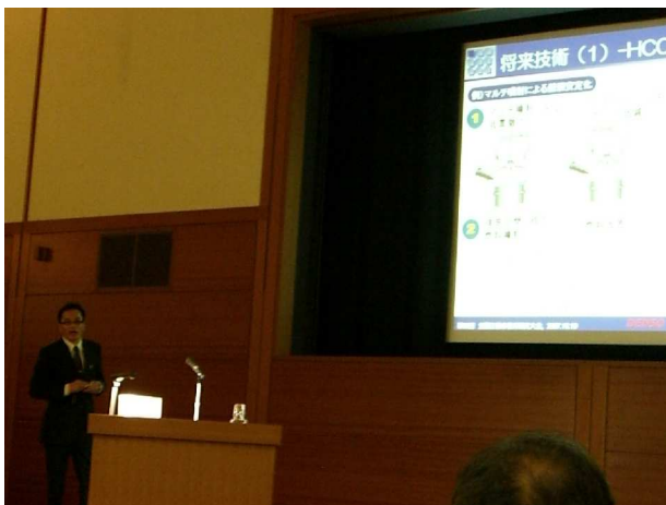
講演「最新のエンジンマネジメント」 (株)デンソー