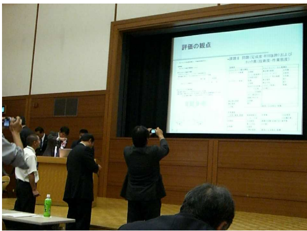
研究発表・研究協議