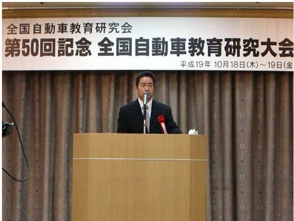
文部科学省 担当調査官挨拶