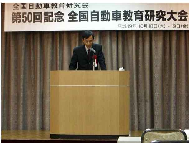
日本自動車整備振興会連合会 挨拶