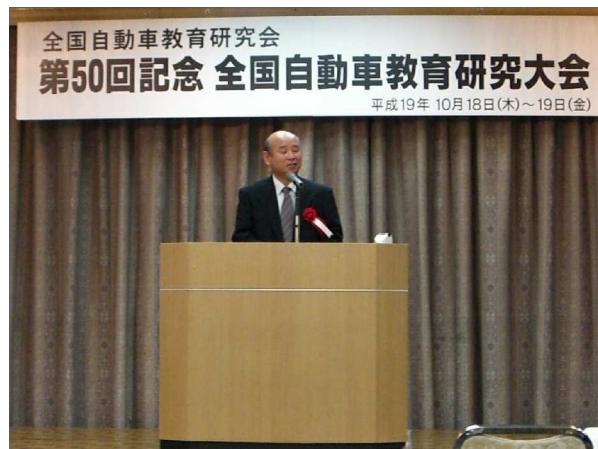
愛知県工業高等学校長会 挨拶