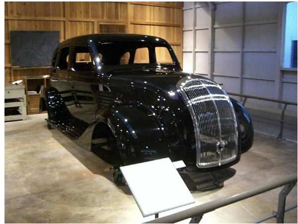
トヨタテクノミュージアム 産業技術記念館