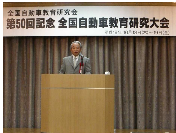
愛知県教育委員会 挨拶