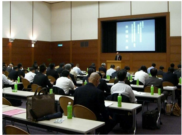
研究発表・研究協議