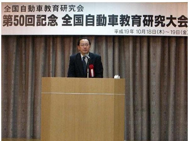
国土交通省 中部運輸局 挨拶