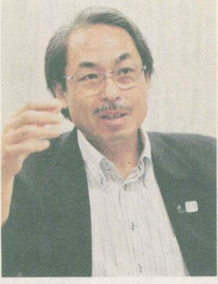
全国自動車教育研究会(全自研)会長 (東京都立六郷工科高等学校統括校長)

「工業高は、卒業生が就職先を決めるまで、学校側がサポートしているんです。卒業生が就職先を決めた後、就職先が学校に問い合わせると、就職先と学校の間でやりとりをします。就職先から学校に問い合わせると、学校が就職先に対して、卒業生が就職先で活躍できるようにサポートします。」