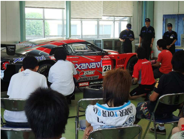
オープンキャンパスでのイベント