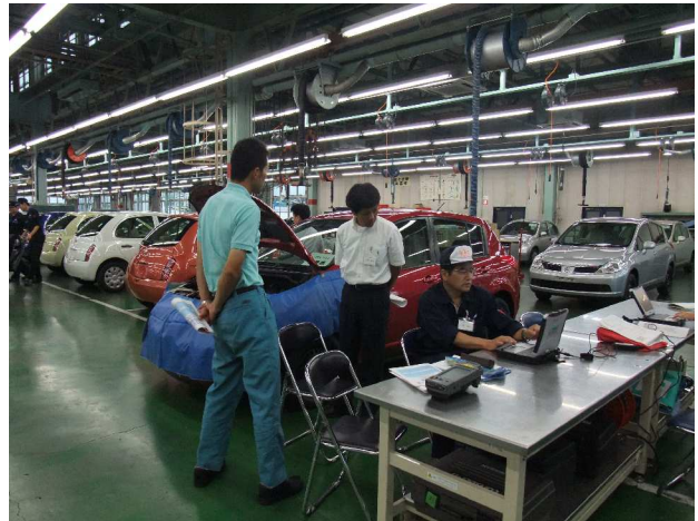
外部診断機での実習